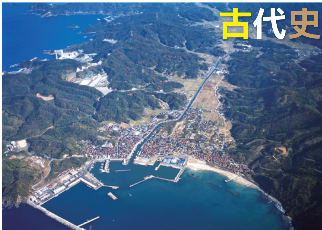
島根半島の地質的に変化する山塊の切れ目、「多久の折絶(たくのおりたえ)」の日本海側・恵曇からの空撮