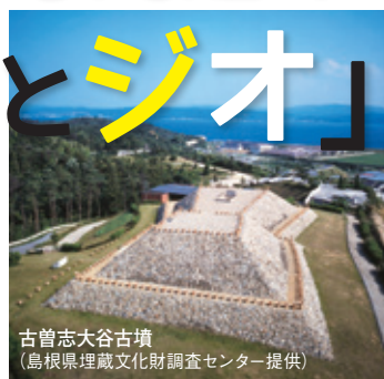
古曾志大谷古墳